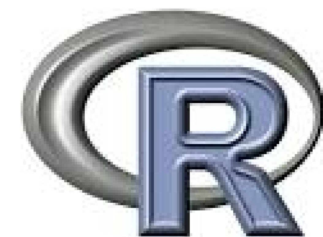
Figura 2. Software estadístico utilizado durante la actividad formativa.